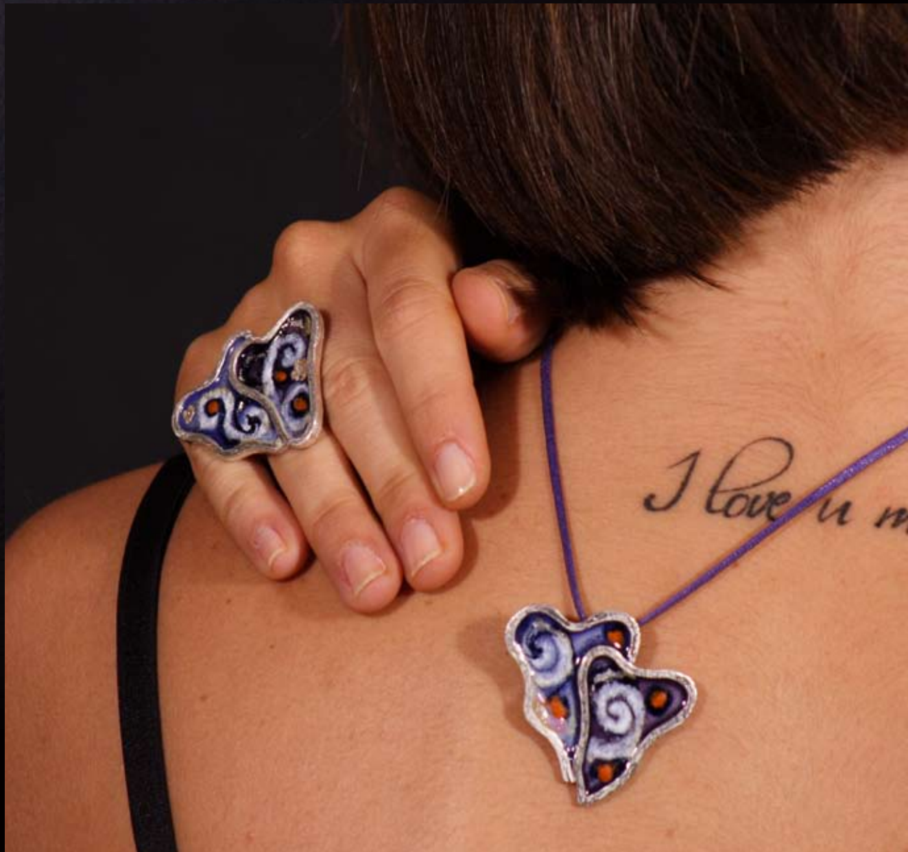
Serié Hojas Leaves Collection

Everyone must take time to sit and watch the leaves turn.